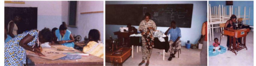
Formació professional de dones al Centre Catalunya