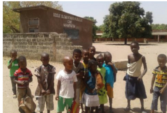
Infants en una escola primària de Mampatim