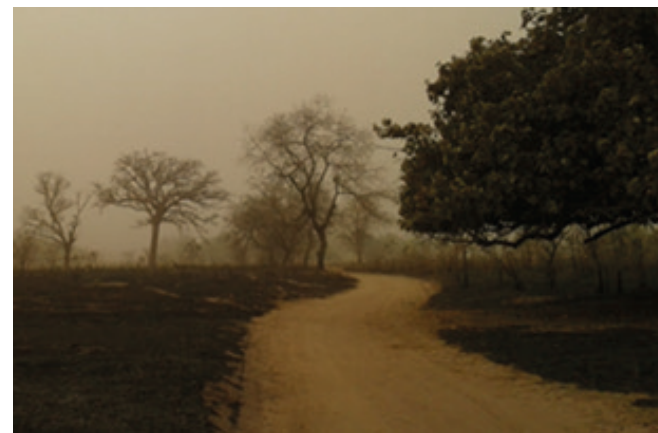
Focs per recuperar pasturatge i conreus.