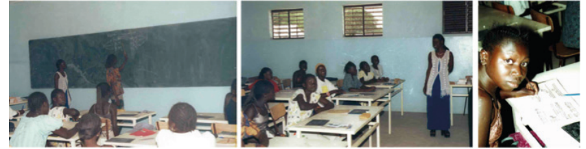
Formació de noies al Centre Catalunya

El Centre Catalunya va ser un projecte de molta envergadura. Es va finançar a través del Fons Català de Cooperació per al Desenvolupament (projecte 370 FCCD 1997-1999) amb recursos de diversos municipis (Caldes de