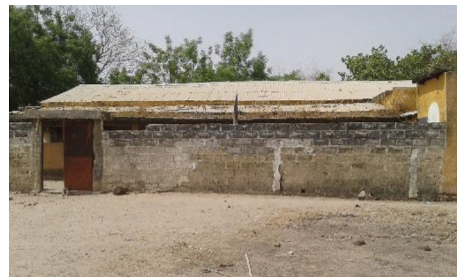
Sala pel jovent de Mampatim (quasi en runes)