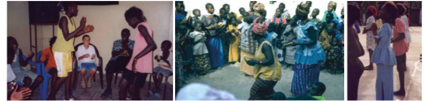
Activitats de lleure per a tothom

Montbui, Les Franqueses del Vallès, Lliçà d'Amunt, Palau-Solità i Plegamans i Sentmenat, i la Diputació de Barcelona) i de diverses associacions (Caldes Solidària, Lliçà Solidari, Sentmenat Solidària, Mans Unides). Actualment