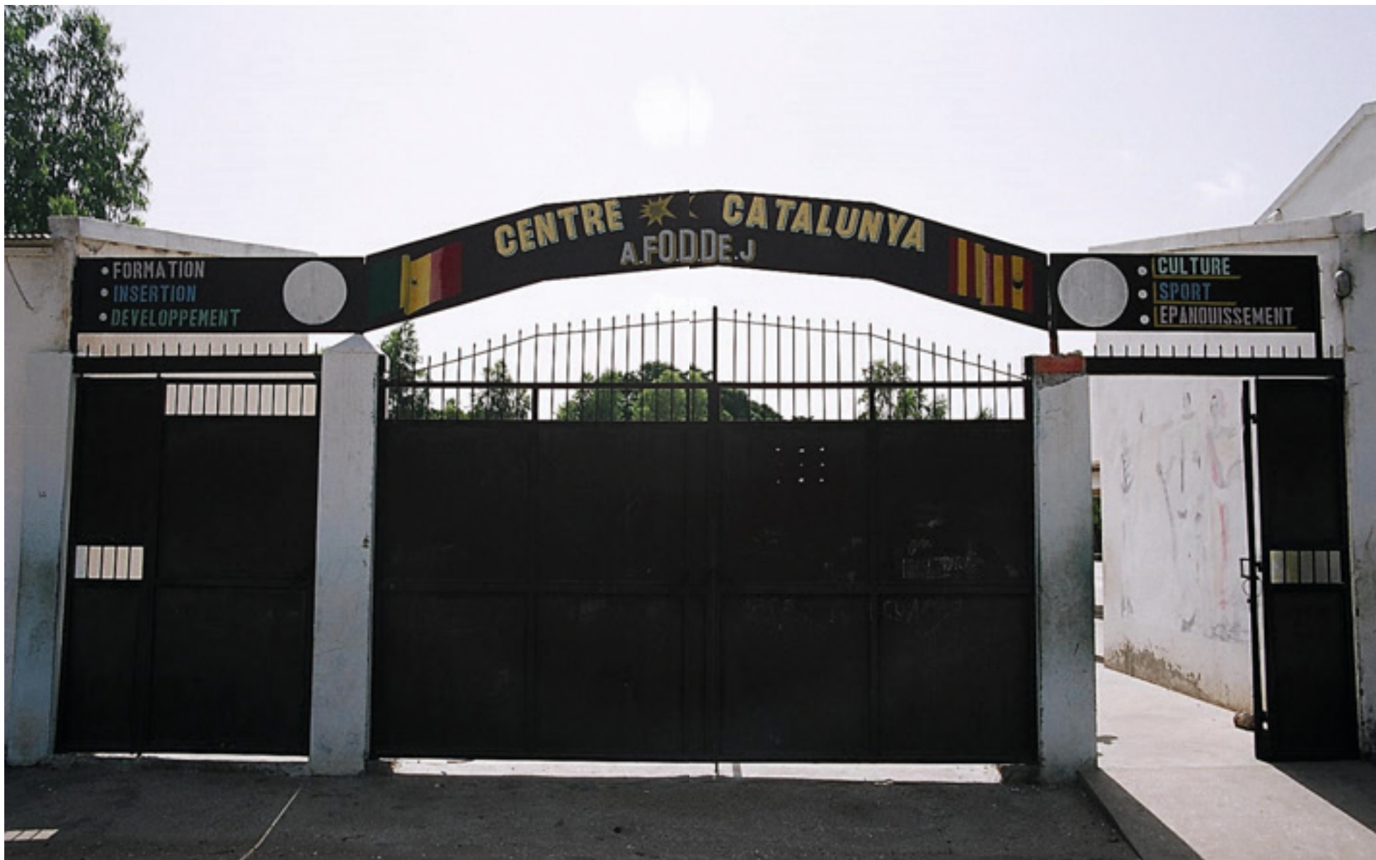
Entrada del Centre Catalunya a Sokone